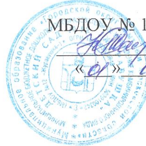
График вакцинации против гриппа работников МБДОУ №12 «Журавушка»