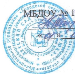
График вакцинации против гриппа воспитанников МБДОУ №12 «Журавушка»